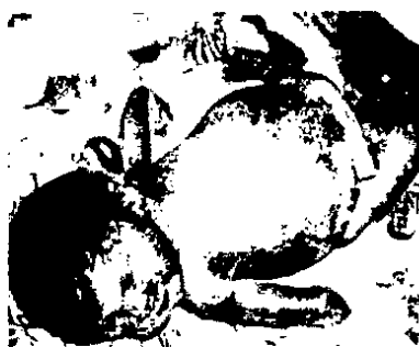
شکل ۱: تصویر نوزاد معرفی شده

سندرم Eagle Barrett که تحت عنوان سندرم Prune Belly یا Triad syndrome نیز نامیده می شود یک ناهنجاری نادر می باشد که بیشتر در پسرها دیده می شود و شامل اختلال عضلانی در جدار شکم، اختلال در سیستم ادراری و گوارشی می باشد. این سندرم در دخترها بسیار نادر است که موردی که معرفی می گردد در یک نوزاد متولد شده در بیمارستان بعثت شهر سنندج مشاهده شده است (شکل ۱).