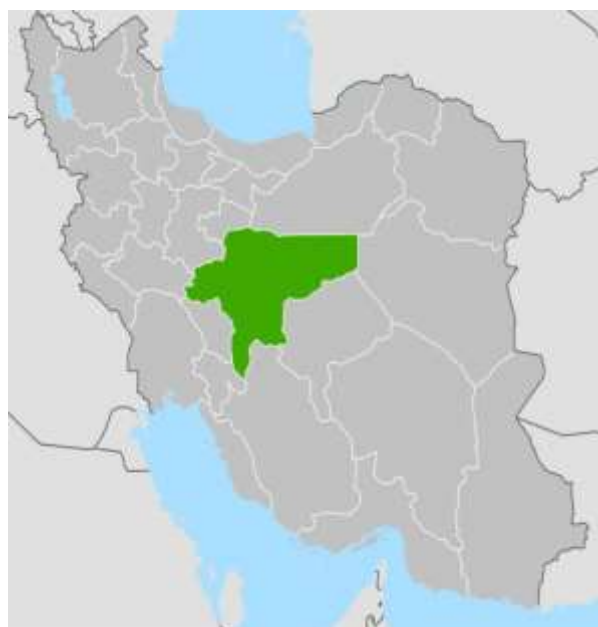
شکل ۱: موقعیت استان اصفهان در کشور ایران و شهرستانهای آن (۱۴)