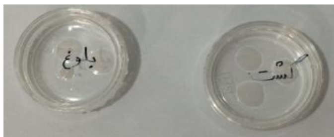
تصویر ۱: قطره‌های محیط کشت در پلیت‌های مخصوص کشت جنین