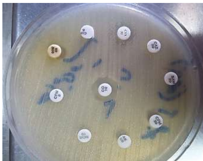
شکل ۲: الگوی مقاومت آنتی‌بیوتیکی یکی از سویه‌های اشریشیاکلی جدا شده از عفونت‌های سیستم ادراری در بیمارستان‌های شهر سنندج در سال ۱۳۹۵.