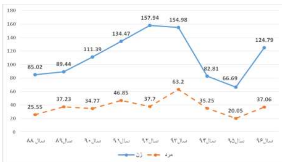
نمودار ۲: میزان بروز خودکشی ناموفق (در صد هزار) به تفکیک جنسیت

میزان بروز خودکشی موفق در زنان شهرستان از سال ۱۳۹۱ سیر صعودی داشته است (بجز در سال ۱۳۹۴ که مقدار مختصری کاهش داشته است) و در سال ۱۳۹۶ به بالاترین میزان خود ۱۰/۶۸ در هزار نفر رسیده است. اما خودکشی موفق در مردان هرچند در طول سالهای مورد مطالعه روند خاصی دیده نشد ولی در دو سال اخیر افزایش چشمگیری داشته است. بالاترین میزان بروز خودکشی موفق در مردان به ترتیب در