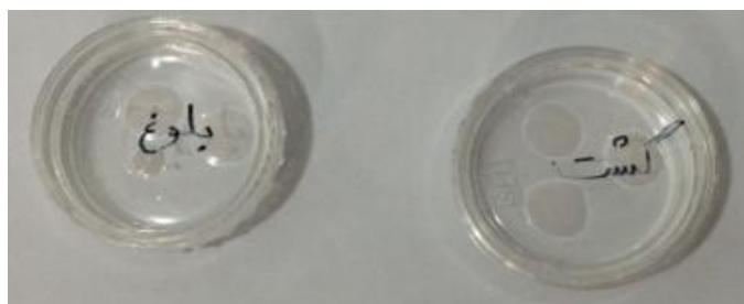
تصویر ۱: قطره‌های محیط کشت در پلیت‌های مخصوص کشت جنین